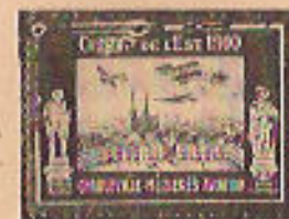
(44 à 44c)