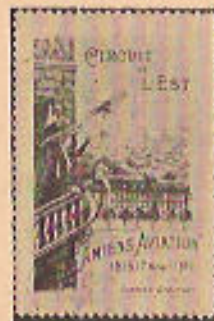
(43 à 43b)