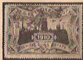
(41c à 41q)