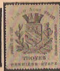
(41a et b)