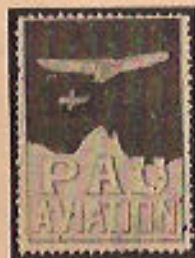
(57 et 57a)