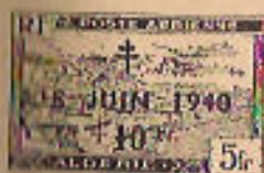
(timbres «Echangiste Universels»)

♦♦ 18 Juin. — Cette année, c'est le 5 F. rouge de poste aérienne qui a reçu une surcharge bleue à croix de Lorraine. 18 JUIN 1940 / +10 F. (Tirage 150.000).