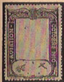
(56 à 56d)