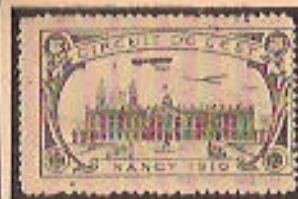
(42a et b)