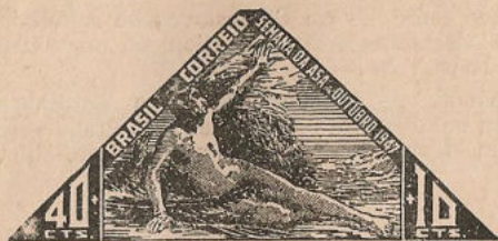
(Timbre du Brésil, voir à chronique de ce pays)

D'autre part, la même «JUSTA» assure les services intérieurs entre Belgrade et Doubrovnik, Belgrade - Zagreb et Susak.